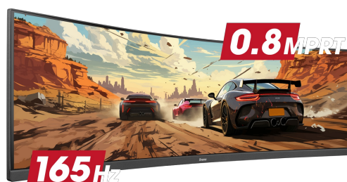
165Hz & 0.8ms MPRT

Ultrabrede 32:9 monitoren met een DQHD 5120x1440 resolutie, ook bekend als Dual QHD, garanderen messcherpe beelden die je games tot leven brengen. Deze monitoren stellen je in staat om je gamingopstelling te organiseren voor een ongeëvenaarde game-ervaring. Geen enkel detail zal aan je voorbijgaan!