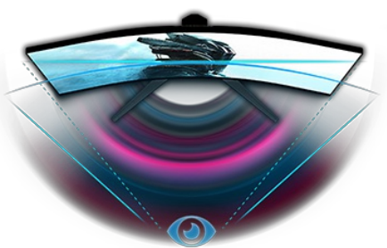
DISEÑO CURVO 1500R

Disponible también con un soporte fijo : G-Master G2766HSU-B1