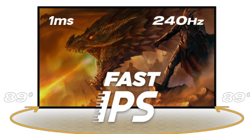
240Hz & 1ms MPRT

Matryca Fast IPS gwarantuje doskonałą jakość obrazu, a możliwość regulacji jasności i ciemnych odcieni za pomocą funkcji Black Tuner zapewnia lepszą widoczność w zacienionych obszarach. Dzięki stopce z regulacją wysokości zadbasz o swój komfort podczas gamingowych maratonów dopasowując położenie ekranu do swoich potrzeb.