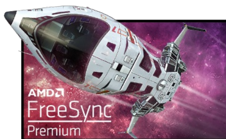
Technologia FreeSync™ Premium

Matryca Fast IPS nie tylko gwarantuje wierne odwzorowanie scen z pola bitwy i wyjątkową dokładność kolorów, ale także niesamowity czas reakcji na ruchomy obraz (MPRT) wynoszący 0.8 ms.