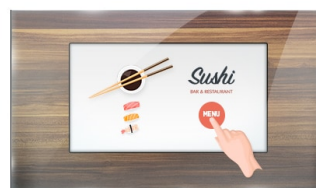
Тач через стекло

IPS displays are best known for wide viewing angles and natural, highly accurate colours. They are especially suited for colour-critical applications.