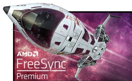
Technologie FreeSync™ Premium

La dalle Fast IPS garantit non seulement des scènes de champ de bataille vives et de haute fidélité affichées avec une précision de couleur exceptionnelle, mais elle offre également un temps de réponse d'image en mouvement (MPRT) exceptionnel de 0.8 ms.