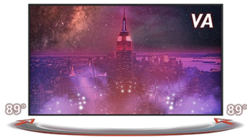
DALLE EN TECHNOLOGIE VA

Un temps de réponse rapide est la clé pour des jeux aux images ultra fluides. Cela réduit l'effet "fantôme" et cela assure donc à son utilisateur une expérience et des performances inédites.