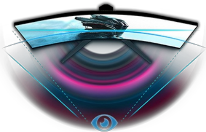
DESIGN COURBÉ 1500R

La dalle VA incurvé 1500R avec un taux de rafraîchissement de 165Hz, un MPRT de 0.2ms et une résolution de 2560x1440 vous offre une expérience visuelle exceptionnelle et garantit une superbe qualité d'image. Le support réglable en hauteur vous permet d'ajuster facilement la position de l'écran et les paramètres d'écran facilitent la personnalisation des modes de jeu prédéfinis et personnalisés. En plus, la fonction Black Tuner vous permet de contrôler les scènes sombres pour vous assurer que les détails soient toujours clairement visibles.