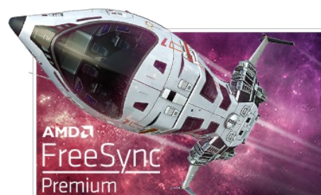
FreeSync™ Premium Technology

La dalle Fast IPS garantit non seulement des scènes de champ de bataille vives et de haute fidélité affichées avec une précision de couleur exceptionnelle, mais elle offre également un temps de réponse d'image en mouvement (MPRT) exceptionnel de 0.8 ms.