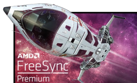
Technologie FreeSync™ Premium

La Résolution UHD (3840 x 2160), plus connu sous la dénomination 4K, vous offre une zone d'affichage gigantesque avec 4 fois plus d'espace d'information et de travail qu'un écran classique en Full HD. En raison de sa haute densité de points par pouce (DPI), il affichera des images incroyablement fines et pointues.